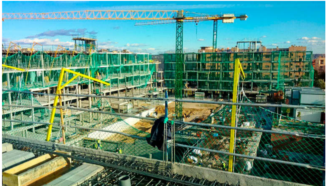
Una promoción de viviendas impulsada por Neinor Homes en la primera fase de su construcción.

Desde esta asociación confirman que ya se han realizado presentaciones de este programa en los consistorios de Madrid, Pozuelo de Alarcón y Leganés. «Si somos capaces de que un primer ayuntamiento implemente esta