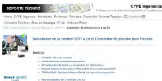
CYPE TERMAGRAF 2017

En este sentido, TermaGraf se incorpora al equipo de CYPE Ingenieros como revisor independiente en el Generador de Precios aportando su experiencia y conocimiento en los ensayos de estanqueidad Blower-door y termografía