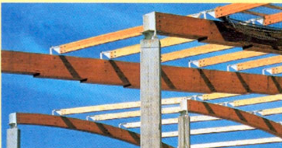
Fabricación y montaje de estructuras en madera