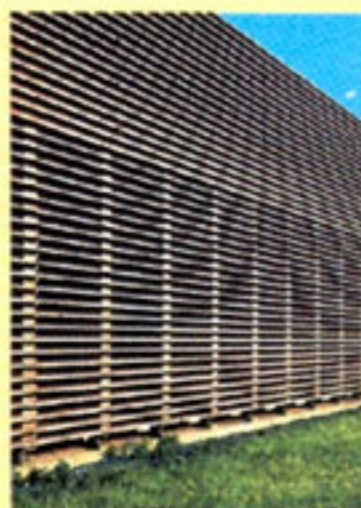
Revestimientos de fachadas en madera