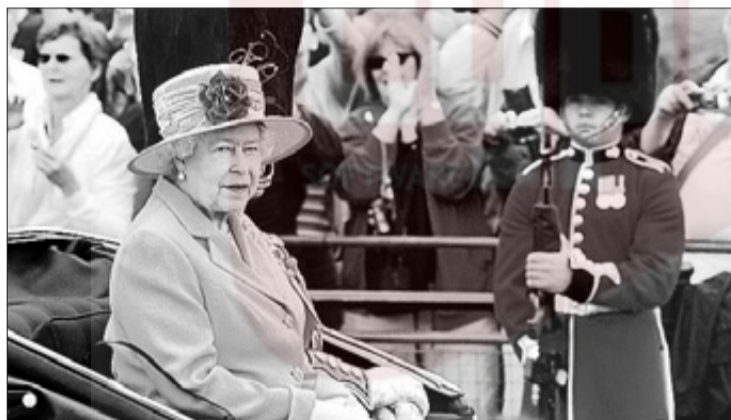
Isabel II, Reina de Inglaterra, en un acto reciente.

EFE LONDRES ■ La reina de Inglaterra, Isabel II, se ha unido a la generación Facebook con el lanzamiento de una página sobre la Monarquía británica en la popular red social, según informó Buckingham Palace. A partir de hoy, millones de usuarios podrán echar un vistazo a la web real, en la que se colgarán imágenes, vídeos y noticias relacionadas con la familia real. La página también incluirá una circular en la que se dará parte de los compromisos reales oficiales de la jornada previa. Con la creación de la web, la soberana, que en el pasado admitió que utiliza internet para enviar e-mails a sus nietos, se convierte en, quizás, la usuaria de la red más famosa de